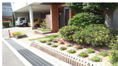
(荻田建設工業 玄関前)