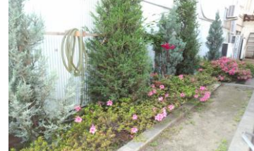
(宮田製作所横の花壇)