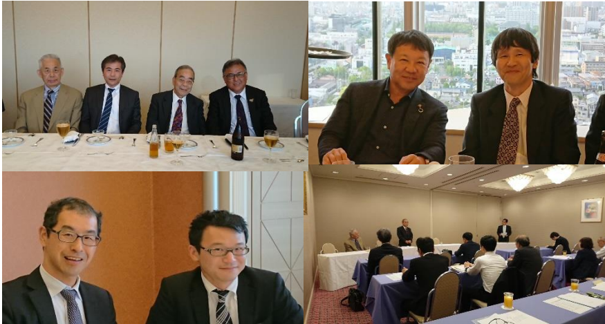
(総会、懇親会の様子)