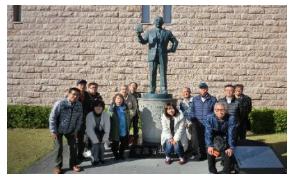
(カップヌードルミュージアム)

たんぼぼ運営委員会では昨年11月に、優良事業場見学会として、池田市のカップヌードルミュージアムにて、世界で唯一のマイカップヌードル造りの体験と様々な展示物の見学を行い、今や世界で新しい食文化となったインスタントラーメンの原点を学びました。午後はキリンビール神戸工場が一番搾りへのこだわりの様や製造ラインの一部を見学し、研鑽を深めることが出来ました。