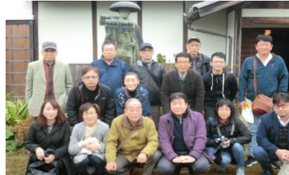
(五個荘近江商人屋敷)

昨秋の組合研修旅行は、当初10月の佐渡島方面が台風19号により中止となったため、11月に行先を近場に変更したものです。天候にもどうにか恵まれ近江商人のふる里五個荘から、多賀大社を参拝し、メタセコイア並木道を散策した後、雄琴温泉で旅の疲れを癒し、懇親を深めることが出来ました。また翌日は近江八幡水郷巡り、ラ・コリーナ近江八幡と歴史文化・風景・味わいとバラエティーに富み、大変有意義な旅となりました。