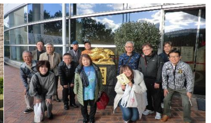
(キリンビール神戸工場)