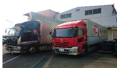
(自社保有トラック)