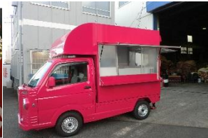
(キッチンカー「クエタライツ car」)