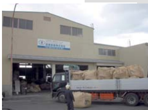
浪速金属(株)工場前面