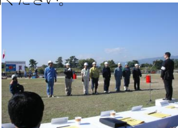
自衛消防隊操法大会