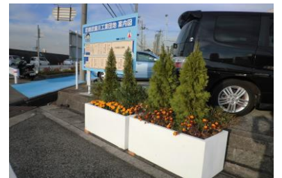
団地入り口プランター