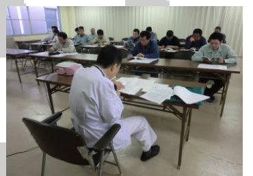
(安全衛生推進者講習) 12/1-2