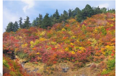
(白山スーパー林道)