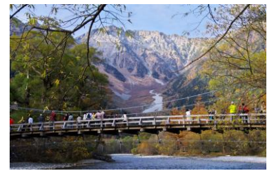
10月21日・・・(河童橋、新穂高)を望む