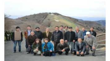
11月9日・・・御在所岳(三重県)にて