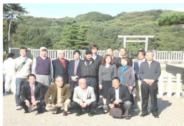
(大阪木材工場団地見学)